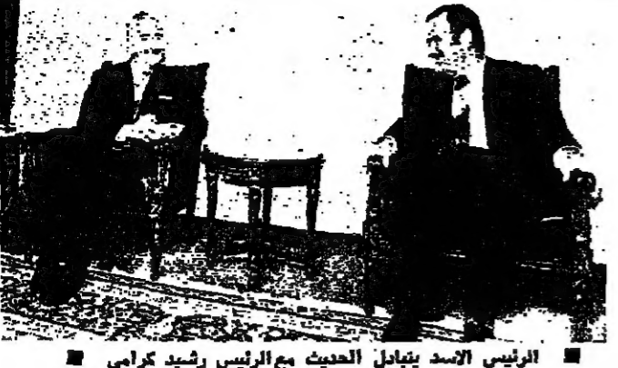
الرئيس الاسد يجادل الحديث مع الرئيس رشيد كرامي (تصوير جوي يظهر)